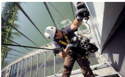
Imagem: Ação de formação de Trabalhos em Altura realizada pela CEDROS

Rever e aprofundar as competências anteriormente adquiridas através de formação teórica e prática, de modo a que os participantes possam utilizar equipamento de proteção individual básico, realizar trabalhos seguros em altura e resgates básicos seguros e abrangentes em altura, assim como realizar a movimentação manual de cargas de forma segura.